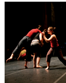
Stage O Vertigo