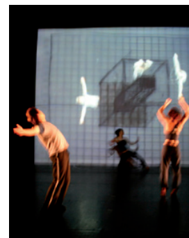
Labo n°4 : Espace/corps • Photo: Ginette Laurin

Les activités du Centre de Création sont possibles grâce au soutien de la Fondation J.Armand Bombardier.