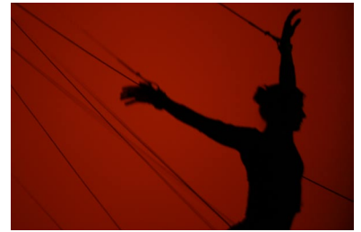
Interprète : Michelle Rhode